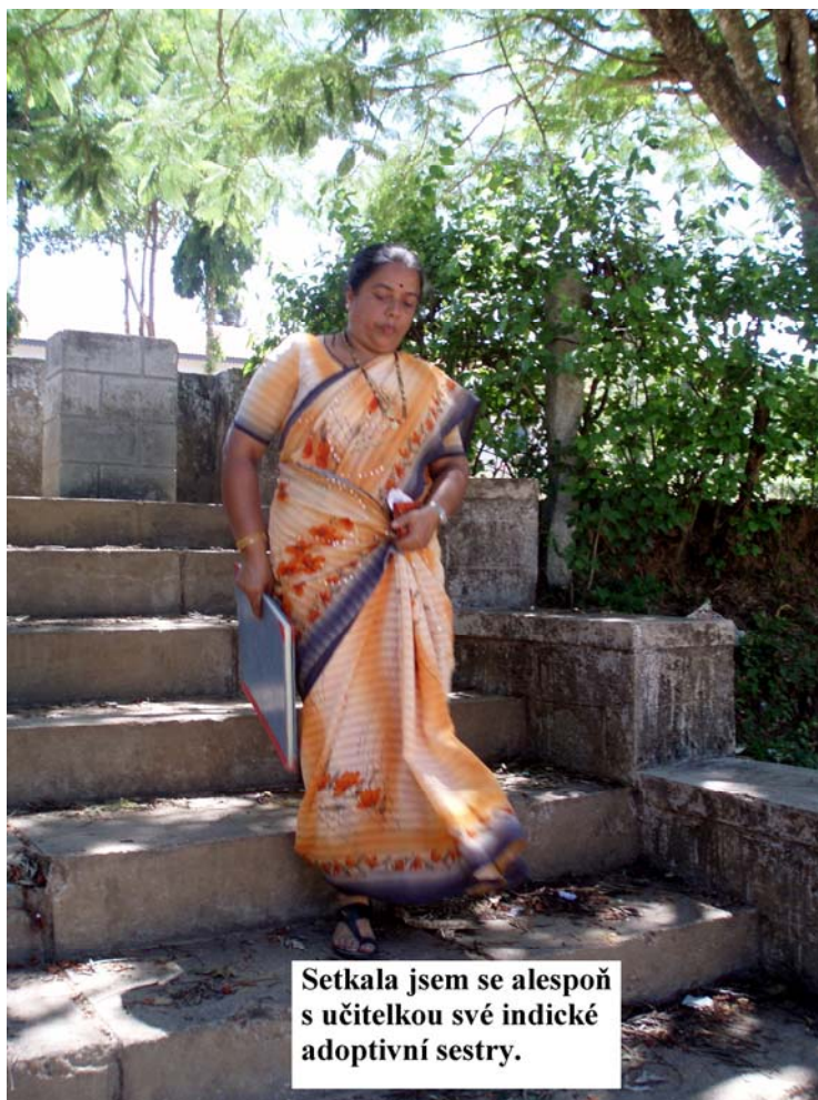
Setkala jsem se alespoň s učitelkou své indické adoptivní sestry.

A tak jsem svou sestru, za kterou jsem podnikla tak dlouhou pouť, nakonec nepotkala. Zůstává pro mne proto stále jen onou zvláštní neuchopitelnou postavou někde v daleké zemi.