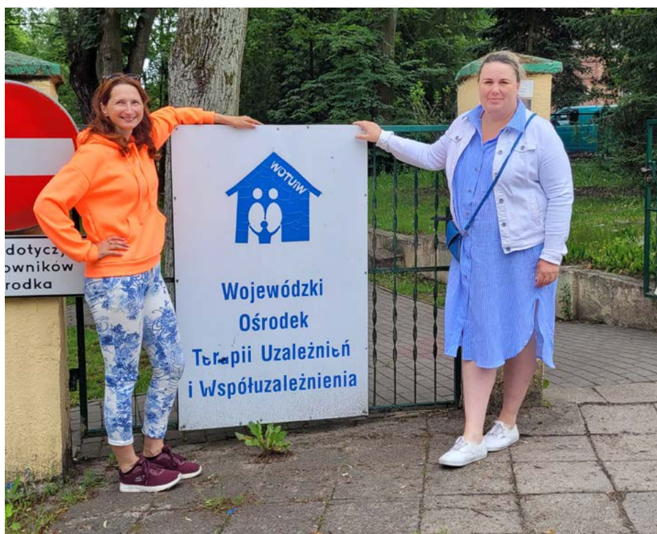
Stáž v adiktologickém centru v polské Toruni