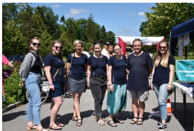
Tým Caritas na Olomoucké štafetu na vozíku