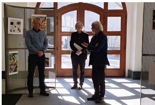
Vernisáž výstavy Můj svět 2021

Dále škola spolupracovala také s Olomouckým arcibiskupstvím, Radiem Proglas, Olomouckým Deníkem nebo např. s odborným časopisem Sociální práce/Sociální práce.