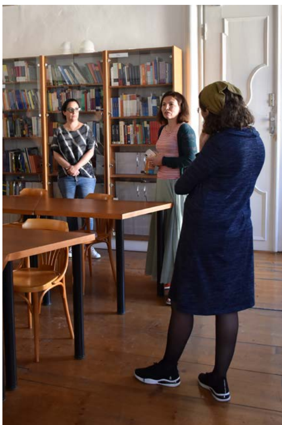
pracovní návštěva pracovníků z univerzit v Gruzii a Izraeli

V červnu 2022 se pak odehrála mobilita tří vyučujících CARITAS do Gruzie . Cílem mobility bylo prohloubit spolupráci s katedrou sociální práce na Tbilisi State University a identifikovat nové příležitosti pro studentské praxe.