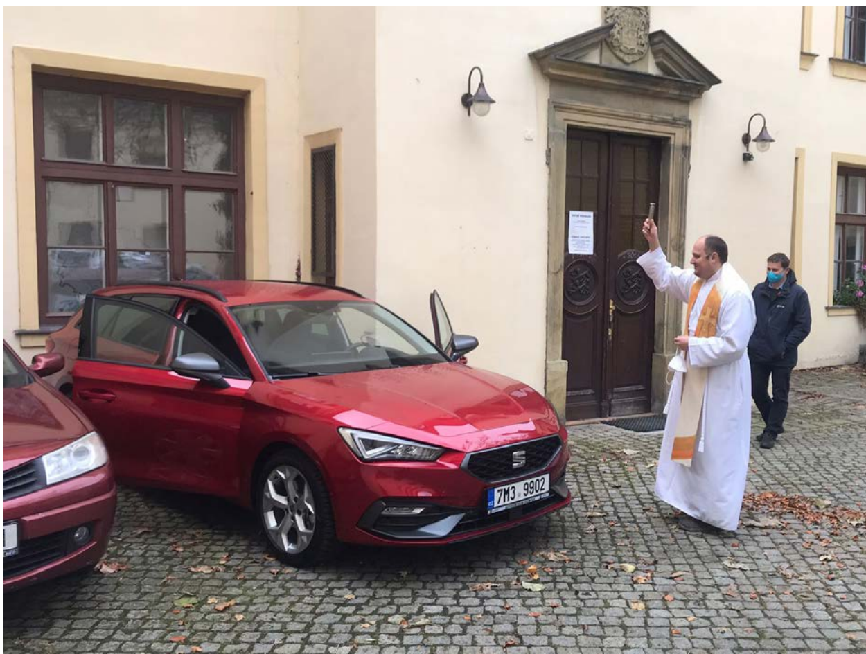
Posvěcení nového osobního auta

O prázdninách roku 2022 jsme vybavili dvě učebny – aulu a velkou učebnu – novým kompletním audiovizuálním zařízením .