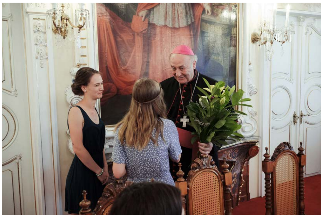
Poděkování otcí arcibiskupovi

V lednu 2022 byl v rámci Strategického plánu školy na roky 2021–2026 formulován Akční plán (AP) na rok 2022 . Realizace tohoto AP byla průběžně monitorována a na konci roku 2022 bude vyhodnocena. V návaznosti na toto vyhodnocení proběhne plánování na rok 2023.